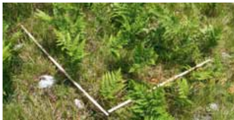
Probe-Quadratmeter mit Adlerfarn ( Pteridium aquilinum L.).