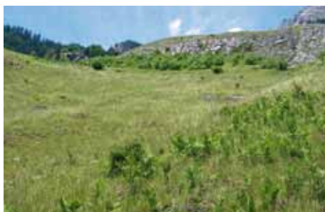
Behandelte (links) und unbehandelte (rechts) Fläche kurz nach dem Eingriff (Ausreissen von Hand) Anfang Juni 2008.